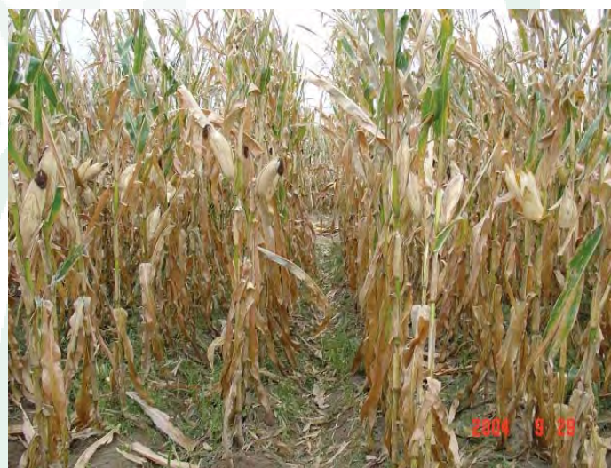
Рис. 3. Ломкость стеблей и обвисание початков – типичные признаки стеблевых гнилей кукурузы. Проведенные в сентябре наблюдения показали, что растения на делянках без внесения калия (вверху) поражались стеблевыми гнилями сильнее, чем растения на делянках с внесением калия (внизу).

распространения стеблевых гнилей снижалась на 50-64%, а урожайность повышалась на 13-23% во всех вариантах опыта с внесением калия, а также калия и хлора. У гибрида Цзидань 180 степень распространения болезней в указанных вариантах снизилась на 44-60%, а урожайность повысилась на 20-29% относительно варианта с внесением только азотных и фосфорных удобрений. Таким образом, стеблевые гнили сильнее подавлялись у восприимчивого к ним гибрида кукурузы, но урожайность зерна в большей степени повышалась у устойчивого к данным болезням гибрида.