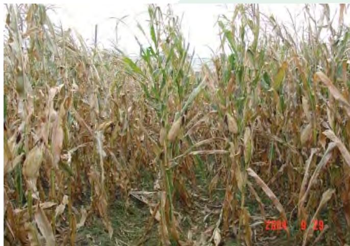
Рис. 2. У растений кукурузы, не получавших калийного удобрения (ряды слева), листья тускнели и становились серозелеными. В то же время у растений, удобрявшихся калием (ряды справа), листья оставались еще зелеными.

1 Одинаковые буквы обозначают отсутствие статистически значимых различий (исходя из НСР, p < 0.05 ).