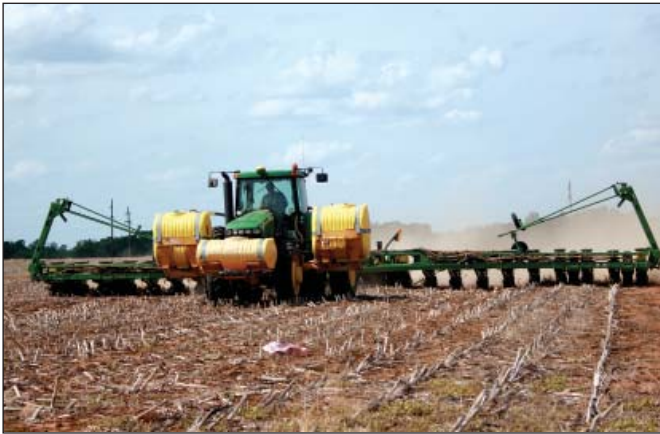
Посев с использованием системы автоматического вождения

пользуется 31% опрошенных. В качестве основного аргумента в пользу использования данной технологии фермеры указали, что во время вождения требуется меньшая концентрация внимания (что, в свою очередь, снижает утомляемость и повышает способность сосредоточиться на других операциях). Хотя системы картирования урожайности с использованием GPS-навигации мало используются в Алабаме, фермеры начинают быстро осознавать преимущества картограмм урожайности не только при оценке общепринятых и новых агротехнических приемов, но также и при использовании в качестве исходных данных при разработке агротехнических приемов, специфичных для конкретных условий (т.е. выделение участков с разными уровнями содержания элементов питания в почве/требующих разных норм высева семян и/или внесения пестицидов, проведение дифференцированного посева, создание карт-заданий на внесение удобрений и т.д.). Опрос также показал, что фермеры рассматривают дискретный отбор