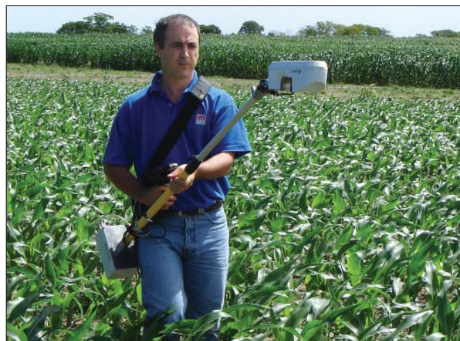
Автор проводит измерения показателя NDVI на поле кукурузы в Паране (провинция Энтре-Риос).

ние растительного покрова, накопленная биомасса, обеспеченность растений элементами питания и другие факторы оказывают влияние на спектральный отклик растений и, следовательно, на возможность выявления недостатка азота. Подходы, основанные на наземном зондировании, требуют наличия технологий для выявления недостатка азота и разработки диагностических методов и рекомендаций по