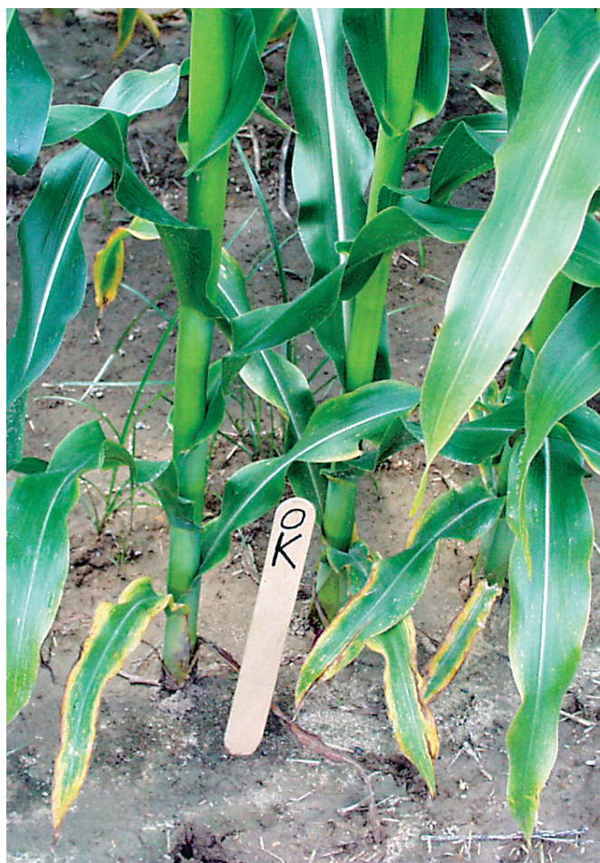
Краевой хлороз и некроз на нижних, старых листьях – визуальный признак недостатка калия. Колышек указывает, что это вариант без калия.