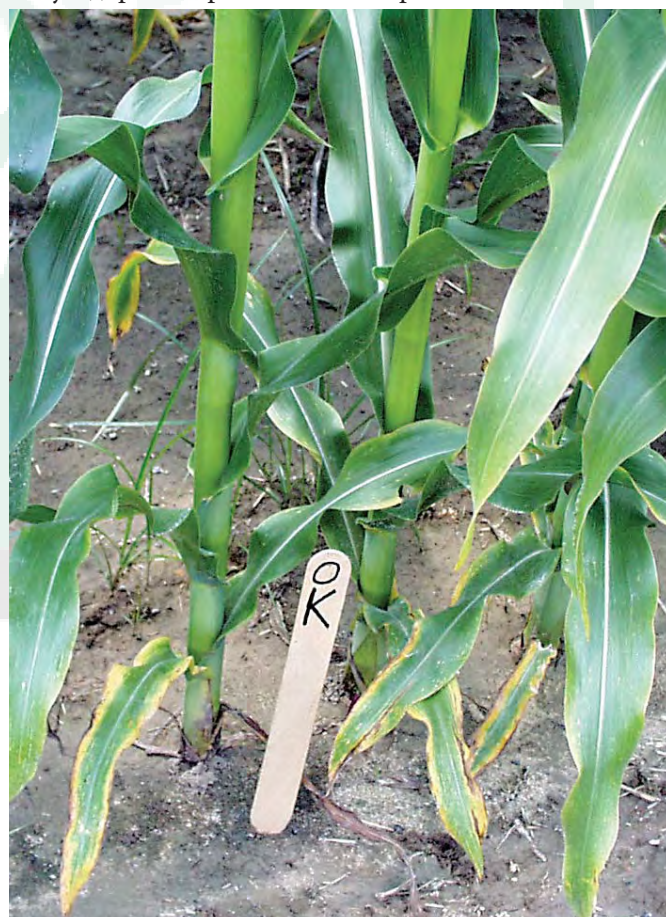
Краевой хлороз и некроз на нижних, старых листьях – визуальный признак недостатка калия. Колышек указывает, что это вариант без калия.

Показателем, с помощью которого можно количественно оценить относительные различия в размерах листовой поверхности растений, является индекс листовой поверхности. Индекс листовой поверхности (ИЛП) – это отношение площади листовой поверхности растений к единице площади поверхности почвы (Watson, 1947). Джордан-Мейлле и Пеллерин (Jordan-Meille and Pellerin, 2004) обнаружили, что у растений кукурузы, испытывающих недостаток калия, более низкий ИЛП, чем у здоровых растений. По сравнению с листьями