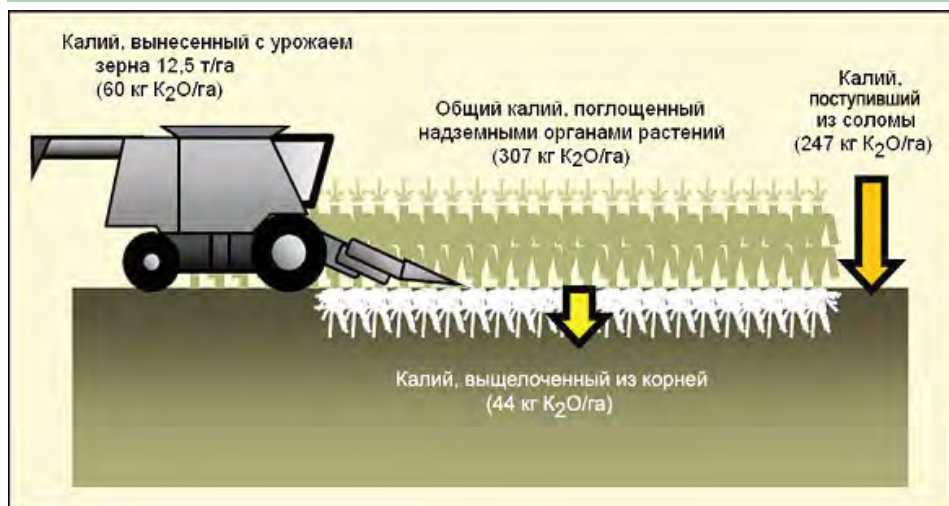
Рис. 3. Оценка выноса К с урожаем зерна кукурузы, а также поступление К в почву из соломы и корней кукурузы. Расчет приведен на урожай зерна кукурузы 12,5 т/га.