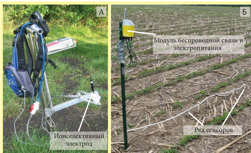
Рис. 1. Оборудование для: а) точечных измерений pH почвы с использованием ручного зонда (Университет Небраски-Линкольна, г. Линкольн, штат Небраска, США), б) точечного мониторинга матричного потенциала почвенной влаги и температуры почвы («Кроссбоу Технолоджи, Инк.», г. Сан-Хосе, штат Калифорния, США).

Примечание: Упоминание какой-либо компании или продукта не означает, что они продвигаются или рекомендуются автором или издателем.