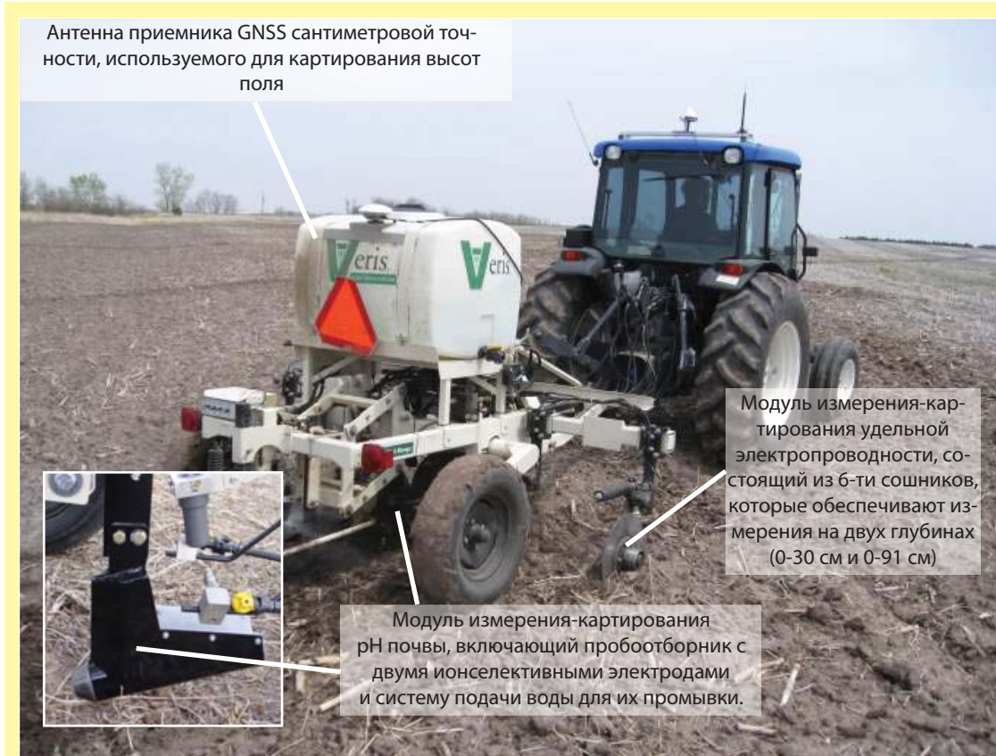
Антенна приемника GNSS сантиметровой точности, используемого для картирования высот поля

тирования физических свойств почвы (integrated soil physical properties mapping system, ISPPMS), разработанный в Университете Небраски-Линкольна. На рис. 3 приведен другой пример – передвижная сенсорная платформа (mobile sensor platform, MSP), которая объединяет в себе устройства по автоматическому измерению и картированию удельной электропроводности и pH почвы, работающие с приемником глобальной навигационной спутниковой системы (global navigation satellite system, GNSS) сантиметровой точности. В этих методах используются разные типы сенсоров. Система ISPPMS измеряет диэлектрические свойства почвы при использовании ёмкостного сенсора для обеспечения лучшей расшифровки значений механического сопротивления почвы, которые получены с помощью оснащенного тензотрами ножа, и измерений оптической отражательной способности почвы, выполненных с использованием набора фотодиодов. С практической точки зрения такая система может использоваться для учета пространственного варьирования влажности почвы и содержания органического вещества, а также плотности почвы. При использовании сельхозпроизводителями метода MSP, исходя из значений pH почвы, отображаются участки поля с кислой почвой, а измерения удельной электропроводности используются для косвенной оценки количества извести, необходимого для повышения pH почвы до требуемого уровня (с учетом почвенной серии). Использование приемника GNSS сантимет-