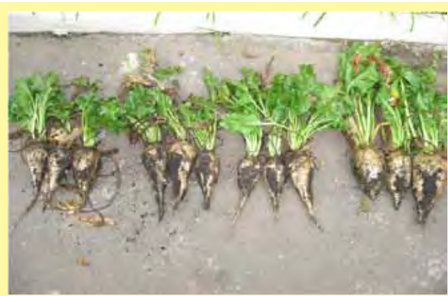
Рис. 2. Сахарная свекла, производственный опыт, Воронеж, 2013.

дозы калийных удобрений в настоящее время не существует, что делает результаты этого проекта источником уникальной информации, прежде всего, для сельхозпроизводителей, нацеленных на получение высокой урожайности.