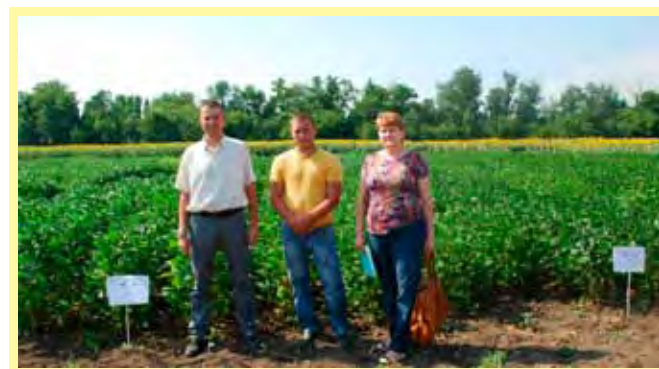
Соя в стационарном опыте (3 августа 2011 г.).

одновременно проводятся в США, Аргентине, Бразилии, Китае, Индии, Мексике, Колумбии и Кении.