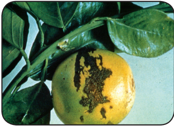
أعراض نقص النحاس في الحمضيات.