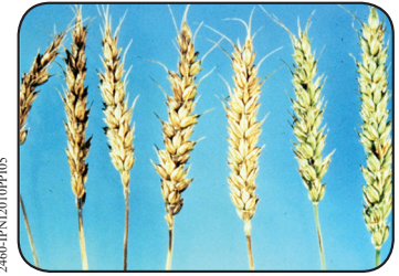
ظهور التصبغ باللون الأصفر على قمم أوراق القمح السليمة نتيجة النقص الشديد للنحاس.

التربة فعاليتها في تحديد نقص النحاس، كما أن التسميد بإضافة النحاس المستخلص بتركيز أقل من 0.4 جزء بالمليون حقق أرباحاً تراوحت بين 19 و 77% تبعاً لمعدلات سعر محصول القمح ومعدل العائد المطلوب. بالمقابل كان من النادر جداً تسجيل أرباح مع التراكيز العالية للنحاس.