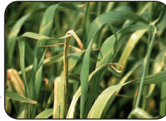
أعراض نقص النحاس الشائعة في القمح تشمل جفاف قمم الأوراق والتفافها وتحولها إلى اللون الأبيض (Pig tailing).