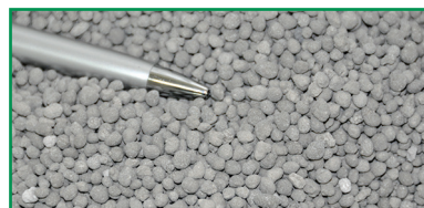
Superfosfato simple granulado.