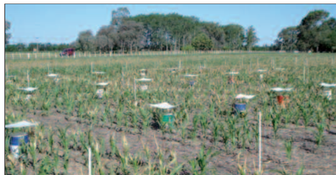
Foto 1. Medición de emisiones de N en forma de NH 3 . INTA, EEA Pergamino, Noviembre de 2008.

El ensayo fue conducido en la localidad de Pergamino, sobre un suelo serie Pergamino, Argiudol típico, Clase de