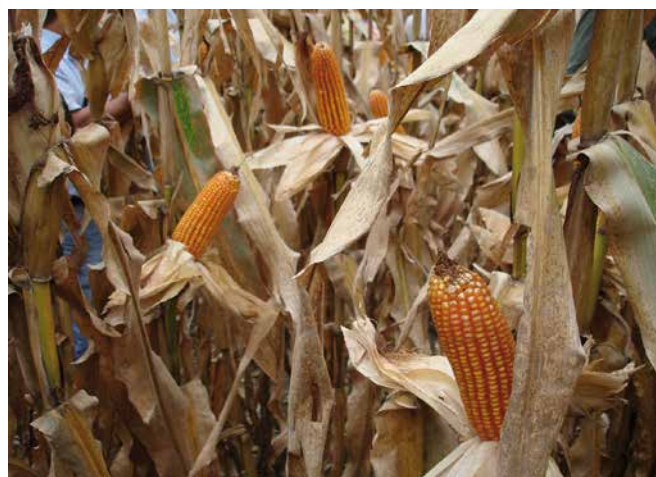
Cultivo de Maíz próximo a cosecha