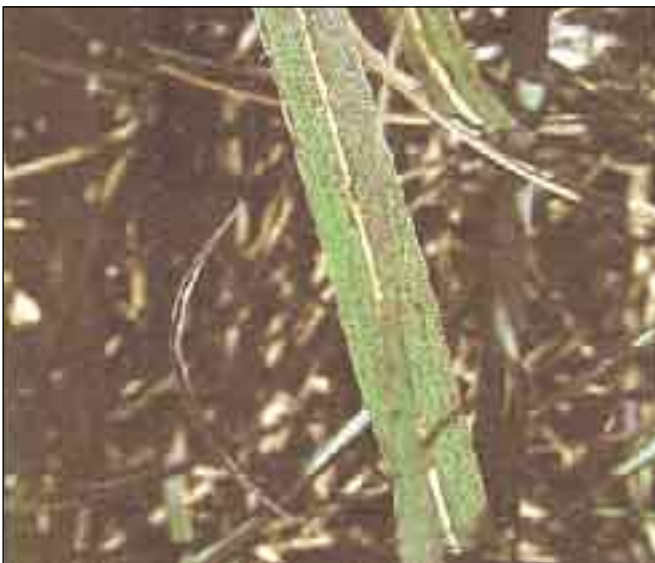
Foto 3. En las hojas viejas la deficiencia de K se presenta como un moteado de puntos necróticos.