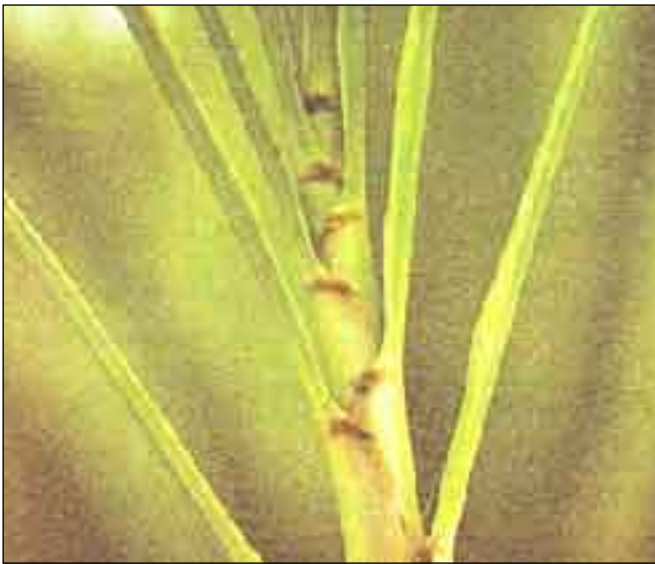
Foto 1. Cuando la deficiencia de K es moderada las hojas jóvenes permanecen verde oscuras y los tallos son delgados.