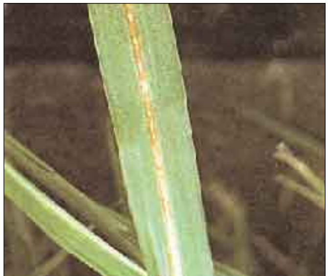
Foto 4. La deficiencia de K se presenta también como una decoloración rojiza de la parte superior de la nervadura central.

Es clásico observar el amarillamiento y la marchitez en los márgenes de las hojas maduras viejas de la parte de abajo de la planta, ocasionando la muerte prematura de la hoja. Esto reduce el área foliar verde donde se realiza la fotosíntesis y limita la cantidad de azúcares producidos por el cultivo. Las hojas más viejas desarrollan un color amarillo - naranja con muchos puntos cloróticos en la lámina de la hoja. Estos puntos se transforman luego en manchas café con centros necróticos (Foto 3). Al irse generalizando estos puntos, el bronceado pardusco se extiende por toda la hoja y aparece una coloración rojiza principalmente en las células de la epidermis de la parte de arriba de la lámina de la nervadura central de la hoja (Foto 4). Al final las hojas empiezan a morir a partir de los márgenes y puntas.