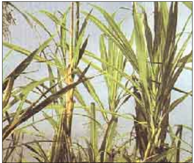
Foto 2. La deficiencia prolongada de K puede afectar el desarrollo del meristemo apical, lo que da a la planta una apariencia de abanico.