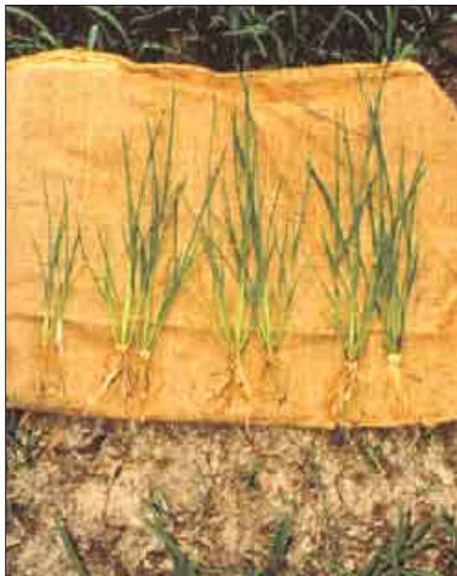
Foto 2. Respuesta de arroz a la aplicación de P.

tores aplica poco o nada de fertilizante potásico. La pérdida promedio neta fue de 38 kg de K/ha en cada cosecha. La deficiencia de K es ahora el factor más limitante para la obtención de rendimientos altos sostenidos.