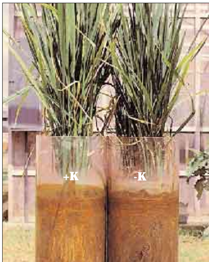
Foto 1. En arroz, el primer signo de deficiencia de K es el de plantas sin crecimiento y más verde oscuras que lo normal. Las raíces de plantas deficientes en K tienen un reducido poder de oxidación. Nótese el color saludable de las raíces en el lado izquierdo contrastando con el color oscuro de las del lado derecho.

El cultivo continuo del arroz en esta área a llevado a una significativa reducción de las reservas de K en el suelo. Aun cuando la absorción de K por el arroz es generalmente más alta que la de N, la mayoría de los agricul-