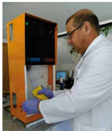
Determinación de nitrato en laboratorio