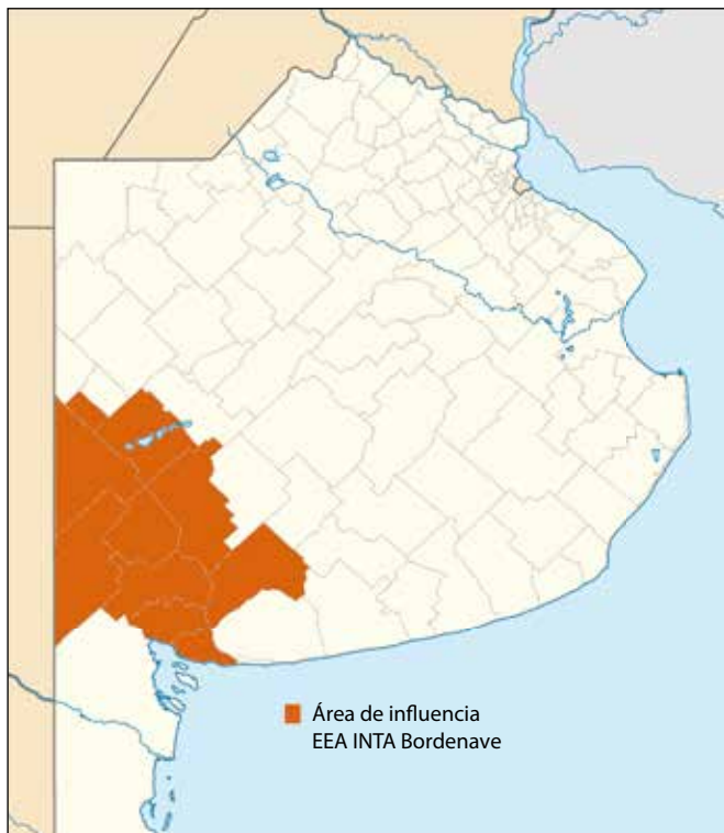
Figura 1. Área de influencia de la EEA INTA Bordenave, Buenos Aires, Argentina.