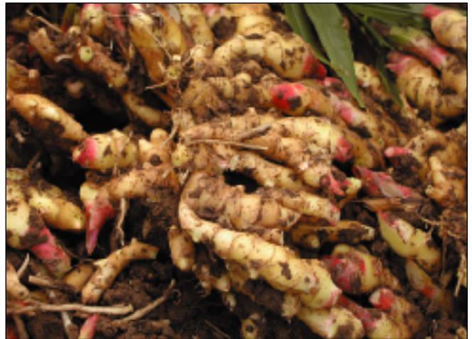
Foto 1.- Tubérculos de jengibre en el campo.

Se condujeron experimentos de campo en bloques al azar en tres sitios en el condado Linquan de la provincia de Anhui en China. Las características básicas de los suelos de estos sitios se presentan en la Tabla 1. Se eligieron seis combinaciones de N y K para los experimentos en los sitios de Yangji y Tanpeng, mientras que en el sitio Farm se probaron siete tratamientos de NK (Tabla 3). Los fertilizantes usados son urea, fosfato de amonio y cloruro de potasio. Se