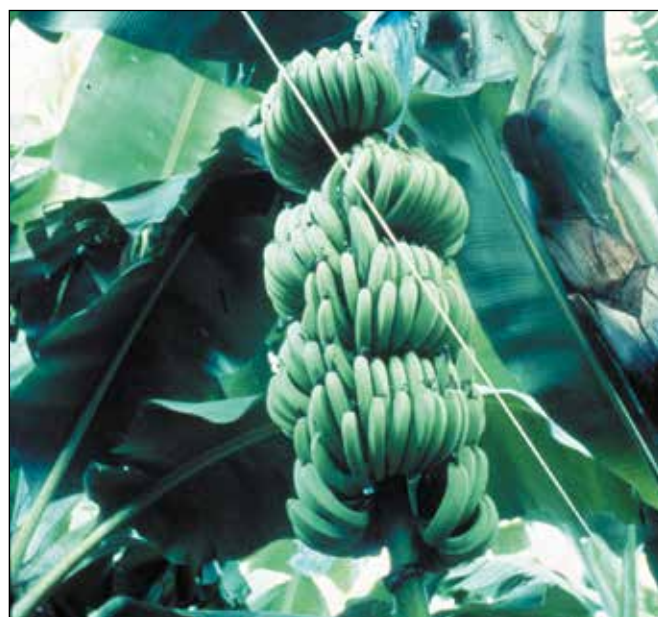
Foto. Racimos de banano de buen tamaño producto de un vigoroso sistema radical.