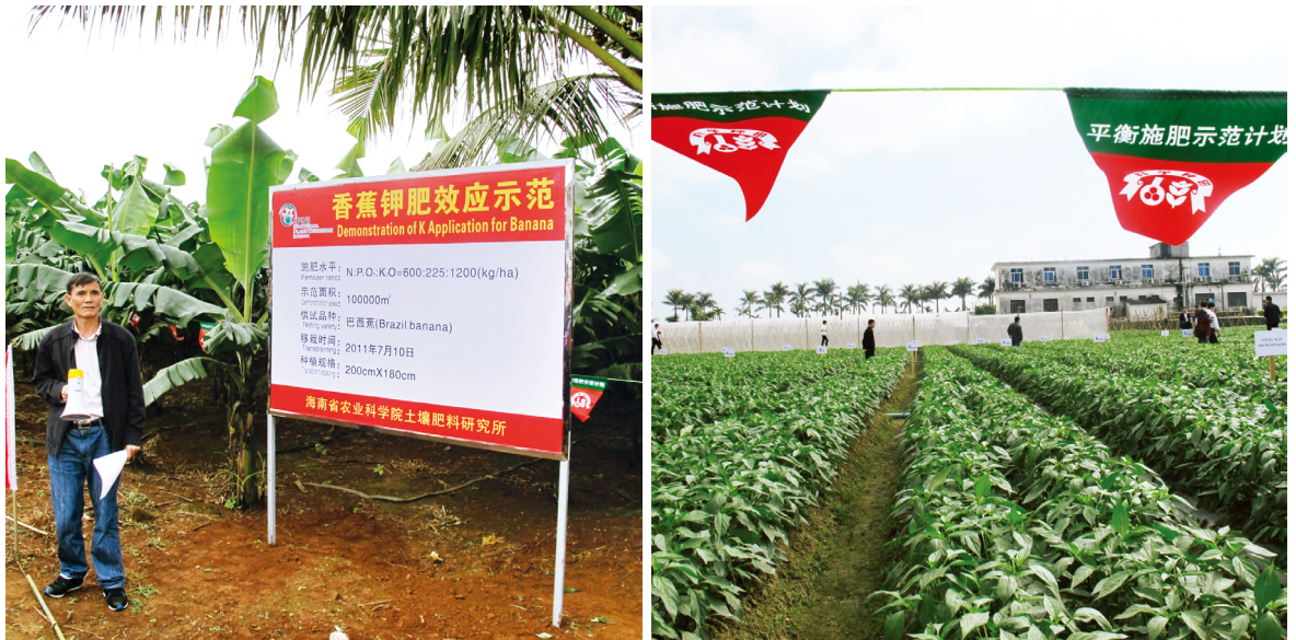
香蕉（左）和辣椒（右）平衡施肥试验示范