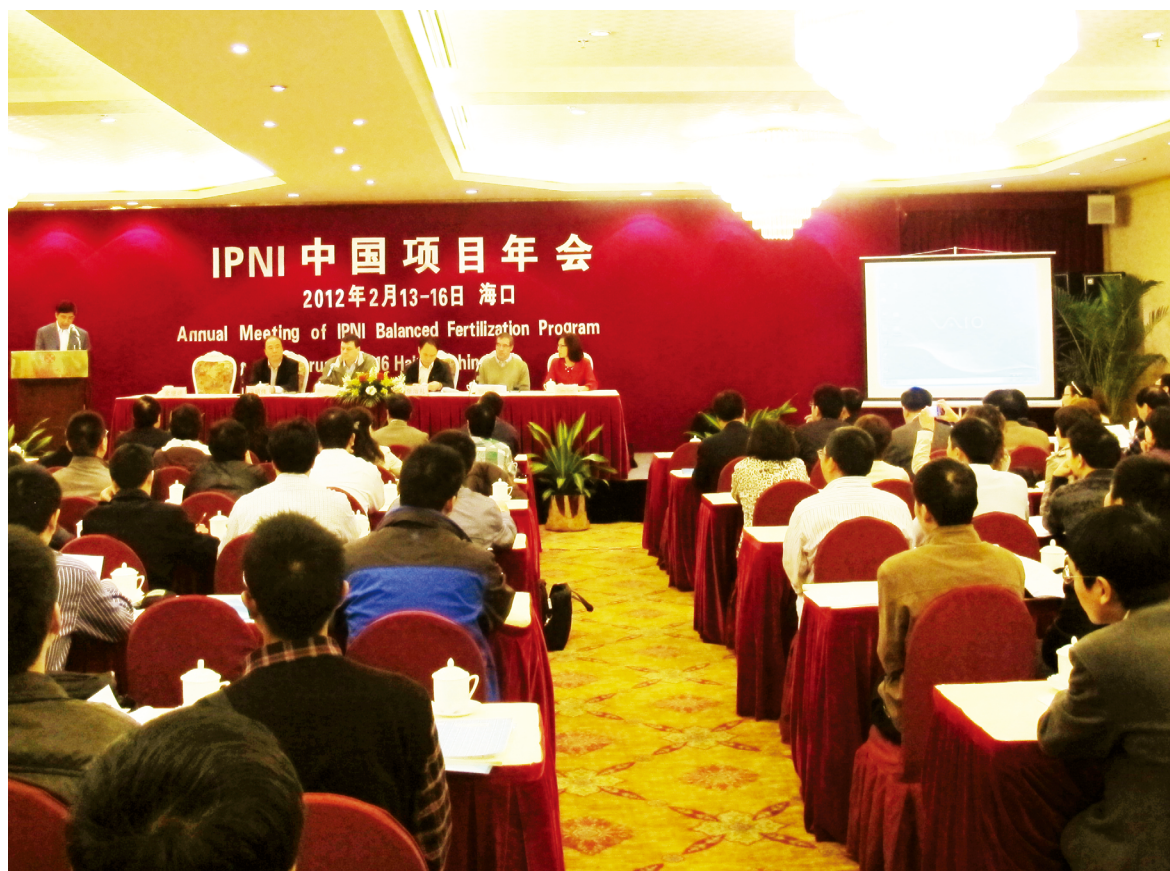
IPNI 中国项目年会大会现场

2 月 14 日下午，前往美兰区现场考察香蕉种植大户的平衡施肥和辣椒钾肥试验示范。2 月 15 日分片区进行 2011 年的工作进展总结和汇报，同时各合作单位与 IPNI 各片区或项目负责人确定了 2012 年度新的工作计划和工作目标。