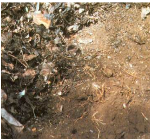
Figura 2. La eficiencia de la aplicación de fertilizantes es mayor cuando coincide con la abundancia de raíces jóvenes activas. Esto es válido para huertos con o sin riego.

Época de aplicación del K.- Según estudios realizados por Zilberstaine et al. (1992), la absorción de K por las raíces de aguacate ocurre a mayor velocidad en los ápices (de color claro) de las raíces finas. Sin embargo, las raíces jóvenes recientemente suberificadas (de color café) realizan la mayor absorción, ya que son las más abundantes (proporción aproximada 1:50). Cuando existe suficiente potasio en la solución del suelo, su absorción por las raíces es a través de un mecanismo pasivo; sin embargo, cuando las concentraciones internas o externas de K son deficientes, el mecanismo de absorción podría ser activo (Cheesman y Hanson, 1979).