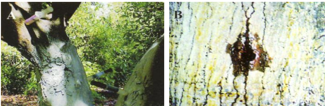
Figura 4. (A) Las inyecciones de soluciones de fósforo y/o potasio al tronco de árboles adultos de aguacate pueden ser útiles para suministrar estos nutrimentos al árbol, sobretodo en suelos deficientes o cuando no se dispone de riego y es necesaria una corrección inmediata. (B) Cicatrización parcial de la perforación, tres meses después de la inyección.

Las inyecciones al tronco con soluciones que contienen P y K pueden ser útiles para proporcionar estos nutrimentos en estados específicos de desarrollo o como un remedio temporal, mientras actúa la fertilización al suelo. Dependiendo de la respuesta del árbol (síntomas y/o niveles foliares), las inyecciones podrían aplicarse una o dos veces al año, procurando realizarlas al comienzo de los flujos de crecimiento vegetativo o del crecimiento inicial del fruto. Investigación preliminar realizada por el autor en Nayarit indica que los niveles foliares de P y K no se afectan por la aplicación de cinco inyecciones/árbol al inicio del flujo vegetativo de primavera, ( Figura 4 ). Se inyectó Nutriphite MR (0% N, 28% P, 26% K) a razón de 1.4 ml de Nutriphite/m 2 de copa (esto es igual a 70 ml de Nutriphite + 30 ml agua por árbol de 50 m 2 de área de goteo). Es necesaria más investigación para determinar el efecto a mediano plazo de estas inyecciones no sólo sobre la composición nutrimental foliar sino sobre el contenido nutrimental del fruto, la reducción de la caída del fruto en junio (México), el incremento en rendimiento y tamaño del fruto y en la presencia de desórdenes fisiológicos. Las inyecciones con P y/o K al tronco podrían ser un buen complemento a la fertilización aplicada al suelo, sobre todo en suelos deficientes, con alta capacidad de lixiviación, fijación o en huertos sin riego.