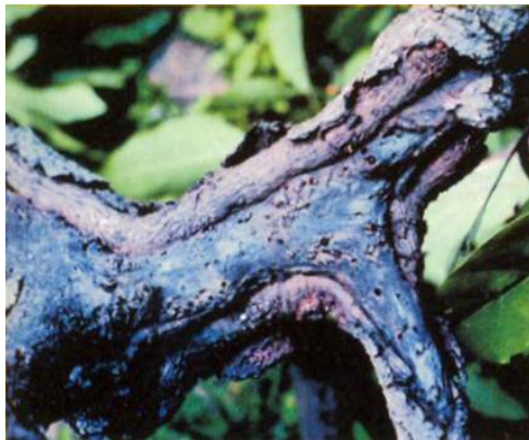
Figura 1. Ataques severos de barrenador de ramas ( Copturus aguacatae Kissinger) han sido relacionadas con desequilibrios nutrimentales, principalmente concentraciones de K en la hoja menores a lo normal.

Se consideró por muchos años como rara la deficiencia de K, sobre todo en huertos jóvenes de aguacate. Sin embargo, a medida que la edad de los árboles avanzó, se fue observado el descenso en la cantidad de K disponible en los suelos de los huertos. Por ejemplo, resultados del muestreo foliar de huertos jóvenes y viejos de aguacate indicaron que los huertos viejos tenían una concentración menor de K que los huertos jóvenes (Oppenheimer et al., 1969), como consecuencia de la remoción gradual de K en un mismo sitio a través de los años.