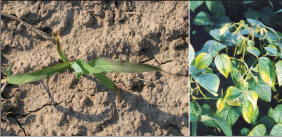
Ocasionalmente el maíz y la soya presentan deficiencia de P y K en Ontario.

y 128 sitios-año que evaluaron la respuesta de soya a K. La investigación presentada fue conducida por muchos científicos especialistas en la fertilidad de suelos en las últimas cuatro décadas.