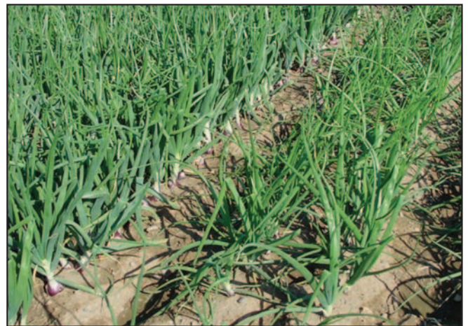
Foto 2. La cebolla responde mejor a la aplicación de P en banda (izquierda) que a la aplicación al voleo (derecha).