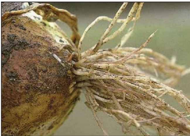
Foto 1. La cebolla tiene un sistema radicular pequeño que limita su habilidad de adquirir nutrientes.

Las cebollas dependen mucho de las micorrizas para obtener el P del suelo. Estos hongos que viven en íntima asociación con las raíces producen una red de hifas que se extiende por el suelo, aumentando apreciablemente el área de absorción del sistema radicular. La recomendación de fertilización con P después de la fumigación es hasta 25% veces más alta que en suelos no fumigados.