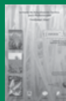
Jornada Fertilidad 2000

INPOFOS Cono Sur ofrece la siguiente combinación de publicaciones - Precio $70.