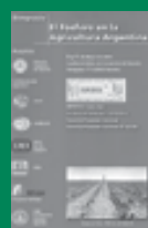
Simposio Fertilidad 2003