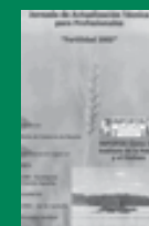
Jornada Fertilidad 2002