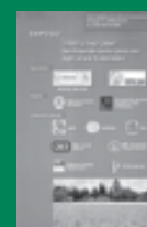
Simposio Fertilidad 2004