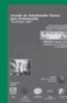
Jornada Fertilidad 2001