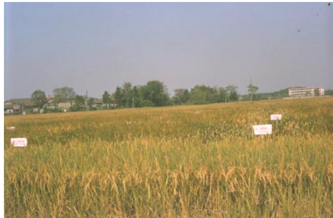
杂交稻高产高效肥水管理技术研究大田现场（右）。