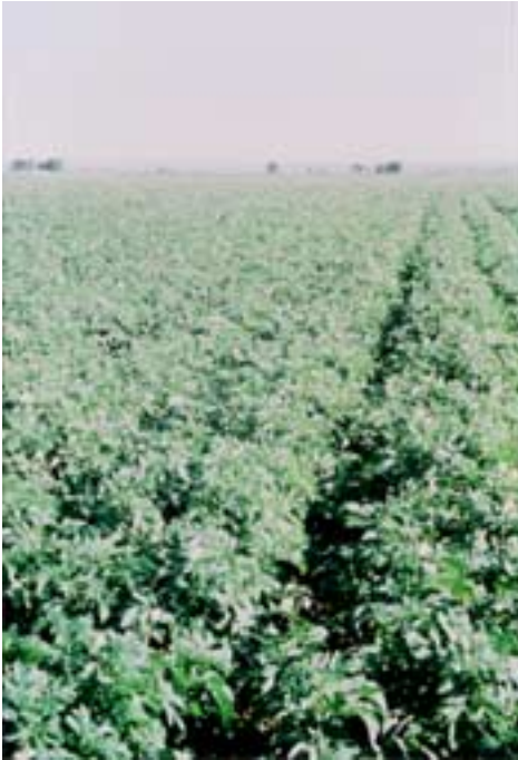
美国爱达荷州的马铃薯田

叶柄中钾的浓度可通过已知钾浓度对时间的关系曲线来进行估算。由于叶柄中钾浓度随时间的变化模式是高度变化的，因此每一田块的曲线都不相同。为了获得最高产量和最佳品质，叶柄中钾的浓度必须高于“钾平衡”浓度，直到薯藤刈掉或收获前 20 天左右。这样不但充分的利用了钾素资源，并使块茎中钾的浓度降低到一个合适的水平。