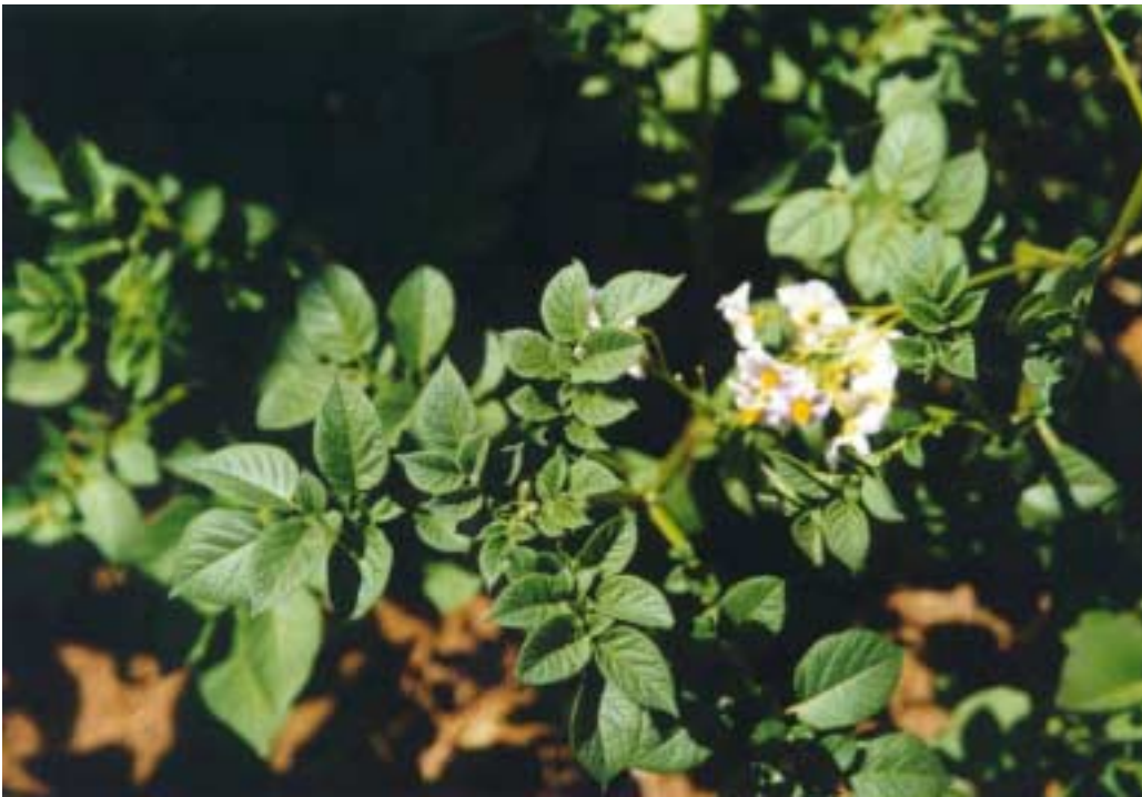
马铃薯为西式食品中最受喜爱的主食之一，中国也种植了相当数量的马铃薯