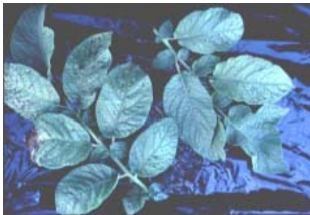
照片：Russet Burbank 马铃薯块茎膨大期中叶片显现缺钾症状

现今北美洲很多种植马铃薯的农户都可达到高产的目标。生产 4.17 吨/亩 (62.5 吨/公顷) 马铃薯块茎的产量，可带走超过 17.6 公斤/亩的氧化钾量。马铃薯块茎在线性膨胀时期，块茎成为碳水化合物和一些可移动无机养分的主要吸收体，并常常会将植株中供应其他营养器官中的养分吸走。绝大部分的养分都是在这—生长期中被吸收的。当植株成熟时，植株顶端及根部的养分和干物质都会被溶解并转移到块茎中。对易移动养分，以钾素来说，收获的块茎中所含有的钾量可占总吸收钾量的 90% 以上，对于不易移动的养分，块茎中仅占总吸收量的 10%–20%。