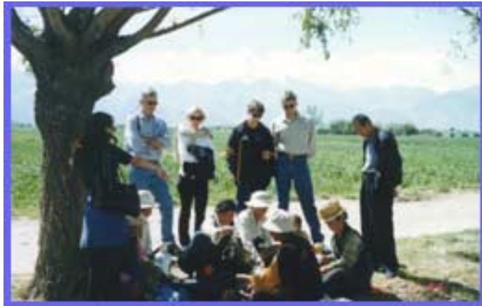
西藏农民在田间午餐

西藏耕地资源丰富，人均耕地 2.8 亩，户均耕地 15 亩以上，劳动力人均种地 7~15 亩以上。但目前区内机械化程度低，多用耗牛耕地，顺犁沟撒种，科学技术推广滞后，田间管理落后。在施肥上科技含量较低，很少施肥或施肥量很低，区内只有氮磷肥销售，且多为有啥施啥，用量随意。田间灌水是挨户轮流灌溉，造成猛灌和用水时间冲突。2000 年全区粮食播种面积 523 万亩，总产 91 万吨，平均亩产 175 公斤左右，最高亩产达 700 公斤左右，生产潜力很大。